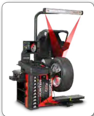
RFE30E показан с опциональным лазерным указателем ВМТ